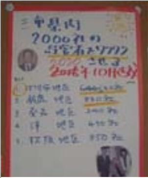
部屋の壁に貼り出してある目標