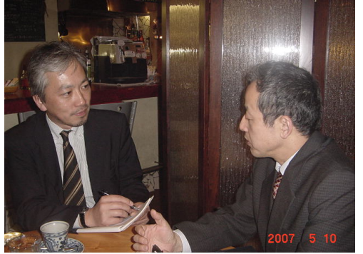
村上編集長じきじきのインタビューでした。

その上で、自分が主たる商品またはサービスの競争相手が少ないことが必要になります。