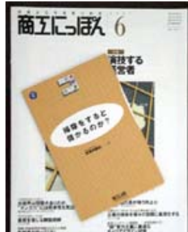
私の記事を無料で差し上げます